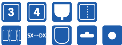
Tipos de sobre / Sachet shape type